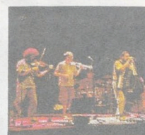
La band friulana Arbe Garbe

Il loro stile è un punto di incontro tra punk e folk. Una miscela sonora contagiosa, divertente, festosa, ma anche ribelle, dissacrante, irruente. È la musica degli Arbe Garbe, formazione di Udine sulla scena da quattordici anni, stasera al Circolo Arci Magnolia. Esordienti nel 1994, con testi in dialetto friulano e beneciano, dialetto di origine slovena parlato in alcune valli della provincia di Udine, gli Arbe Garbe, che in friulano significa erba cattiva, hanno pubblicato sinora cinque album, tra cui l'ultimo Bek , ricco di contaminazioni dal rock allo ska al folk, con fisarmoniche, tamburelli, chitarre, percussioni e fiati. Un sound che per certi versi può ricordare i Mano Negra e che dal vivo è irresistibile.