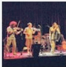
Arbegarbe LA SCIGHERA Via Candiani, 131 ☎ 0239480616 Alle 21.30